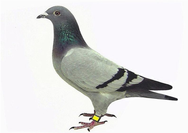
"Blue Gold" B-11-6023005: 1. narodowy AS-gołąb KBDB w 2011 krótsze średnie dystanse młodych gołębi.