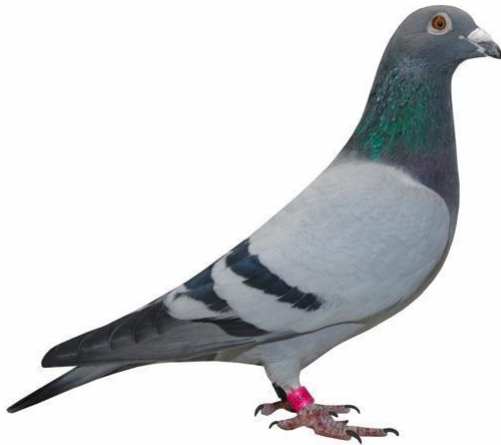
"Blauwe Witpen AS" B-08-6071685: 2009 4. AS-gołąb roczniaki , średnie dystanse w Unii Antwerpia - 2010 1. AS-gołąb stary – średnie dystanse w Unii Antwerpia.